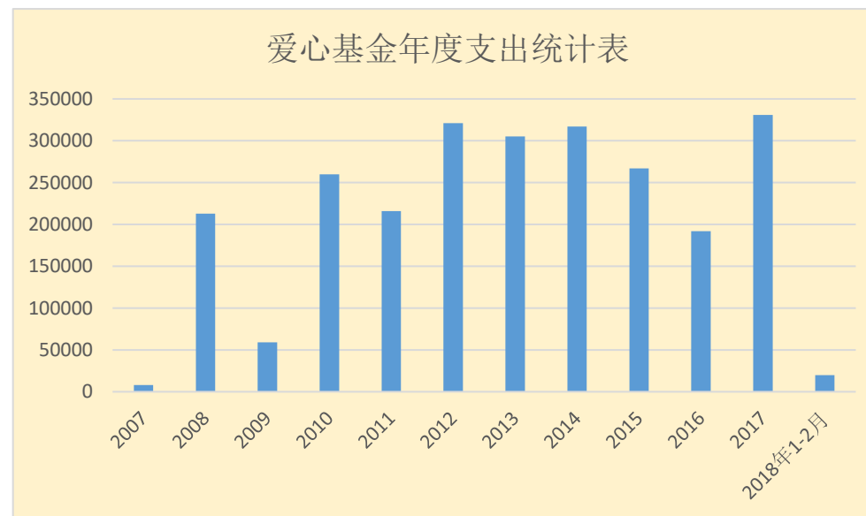
爱心基金捐赠收入支出结余统计表