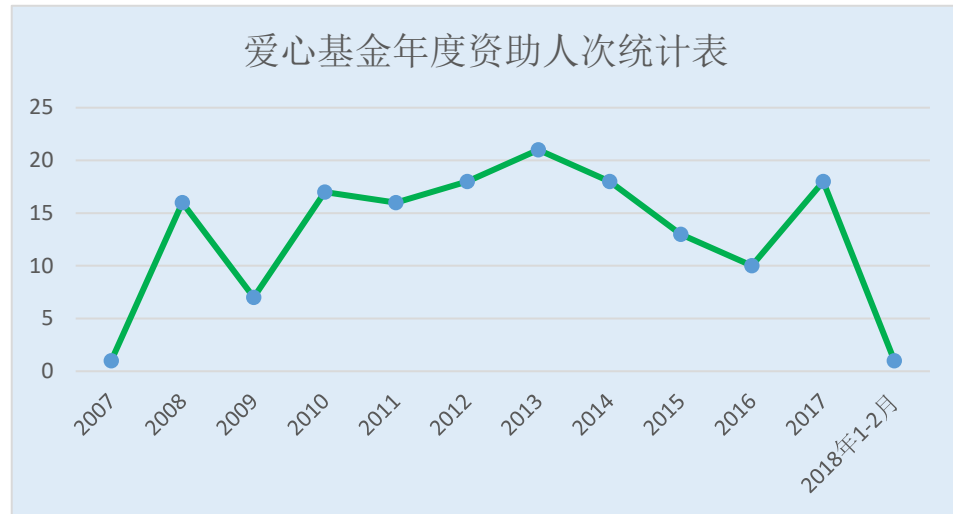
爱心基金年度资助人次统计表